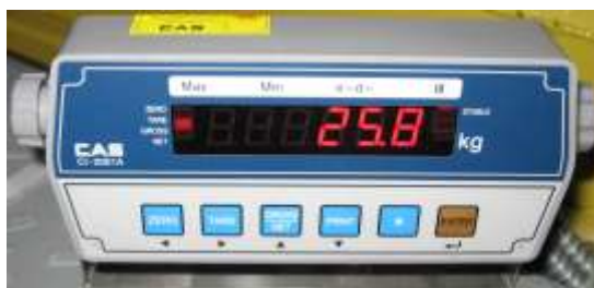
Рисунок 2. Устройство весоизмерительное

1 – тензодатчик, 2 – крышка, 3 – опорная лапа, 4 – выход кабеля с тензодатчиков