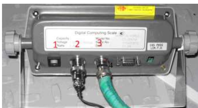
Рисунок 3. Устройство весоизмерительное (Вид сзади)

1 – клавиша включения, 2 – разъем питания, 3 – разъем тензодатчиков